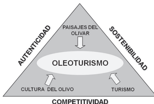
Figura N° 5 Oleoturismo: el turismo relacionado con la cultura del olivo

que concentra, en pocos meses, el trabajo y las rentas de todo el año. Para hacer frente a la variabilidad de la producción y, por tanto, de las rentas de las personas dedicadas al cultivo del olivo, en determinadas comarcas se ha comenzado a ofertar la práctica del oleoturismo, como actividad complementaria vinculada a la cultura del olivo, generándose una simbiosis entre dos sectores, el agrícola y el turístico, representado el desarrollo de esta modalidad la utilización, como reclamo turístico, de todos aquellos aspectos vinculados a dicha cultura (Figura N° 5).