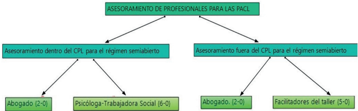
FIGURA 3. FACTORES QUE INFLUYEN EN LA REINSERCIÓN DE LAS PACL. INTERVENCIÓN DE TRABAJO SOCIAL EN EL ÁMBITO PENITENCIARIO

cia bajo el régimen semiabierto no se relacionan directamente con las profesionales de Trabajo Social. Pues, si bien tanto la Trabajadora Social como la Psicóloga han guiado y apoyado el proceso de cambio de régimen mediante talleres y charlas dentro del CPL, se evidencia la poca participación de éstas en el proceso posterior a su salida del CPL. Sin embargo, los entrevistados refieren que, al existir inquietudes e inconvenientes en el normal desarrollo del cumplimiento de la sentencia, acuden a las personas encargadas de los talleres impartidos los días sábados a los cuales asisten de forma obligatoria, donde ocasionalmente coinciden con las Trabajadoras Sociales, puesto que el equipo encargado de esta actividad rota semanalmente (Tabla 9).